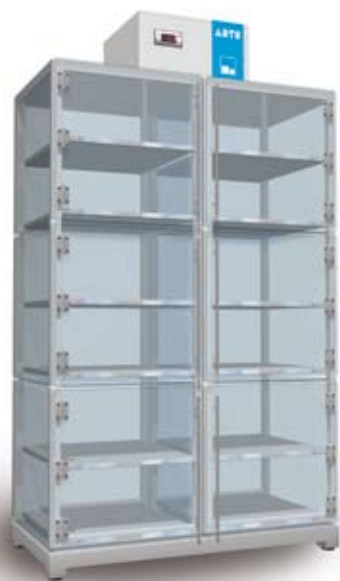
Lagerschrank aus Acrylglas mit Stahlskelett und höhenverstellbaren Fachböden für schwere Lasten.