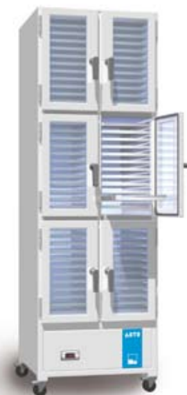
Metallschrank in Sonderabmessung mit ausziehbaren Edelstahl-Schubladen. Die kontrollierte Stickstoff-Einspeisung mit Mess- und Regeltechnik ist im separaten Untergestell eingebaut.