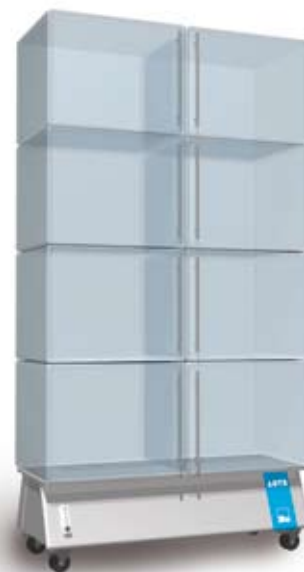
Acrylglas-Lagerschrank mit Einzelfächern und Dauer-Stickstoff-Spülung. Fahrbare Ausführung mit Untergestell.